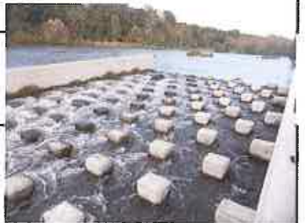
La passe à poisson, après ouverture.