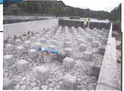
La passe à poisson, avant mise en eau.

Le coût de la passe est réparti entre : l'agence de l'eau, le Conseil Régional et le Conseil Général, ce qui n'entraîne pas de charge pour notre commune.